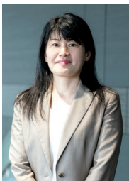
リフォームの三浦 リフォームアドバイザー

リフォームローンを活用する場合は、金利や返済方法についてチェックしておくことが大切です。金利については、市場金利に応じて金利が変動する変動金利タイプと、契約時の金利が返済完了まで変わらない固定金利タイプがあります。返済方法については、元金と利息を合計した総額を返済期間に応じて均等に割って返済していく元利均等返済と、元金を毎月一定額返済していく元金均等返済があります。それぞれメリットとデメリットをよく確認し、返済のしやすさや返済総額を踏まえて自分に合ったタイプを選びましょう。